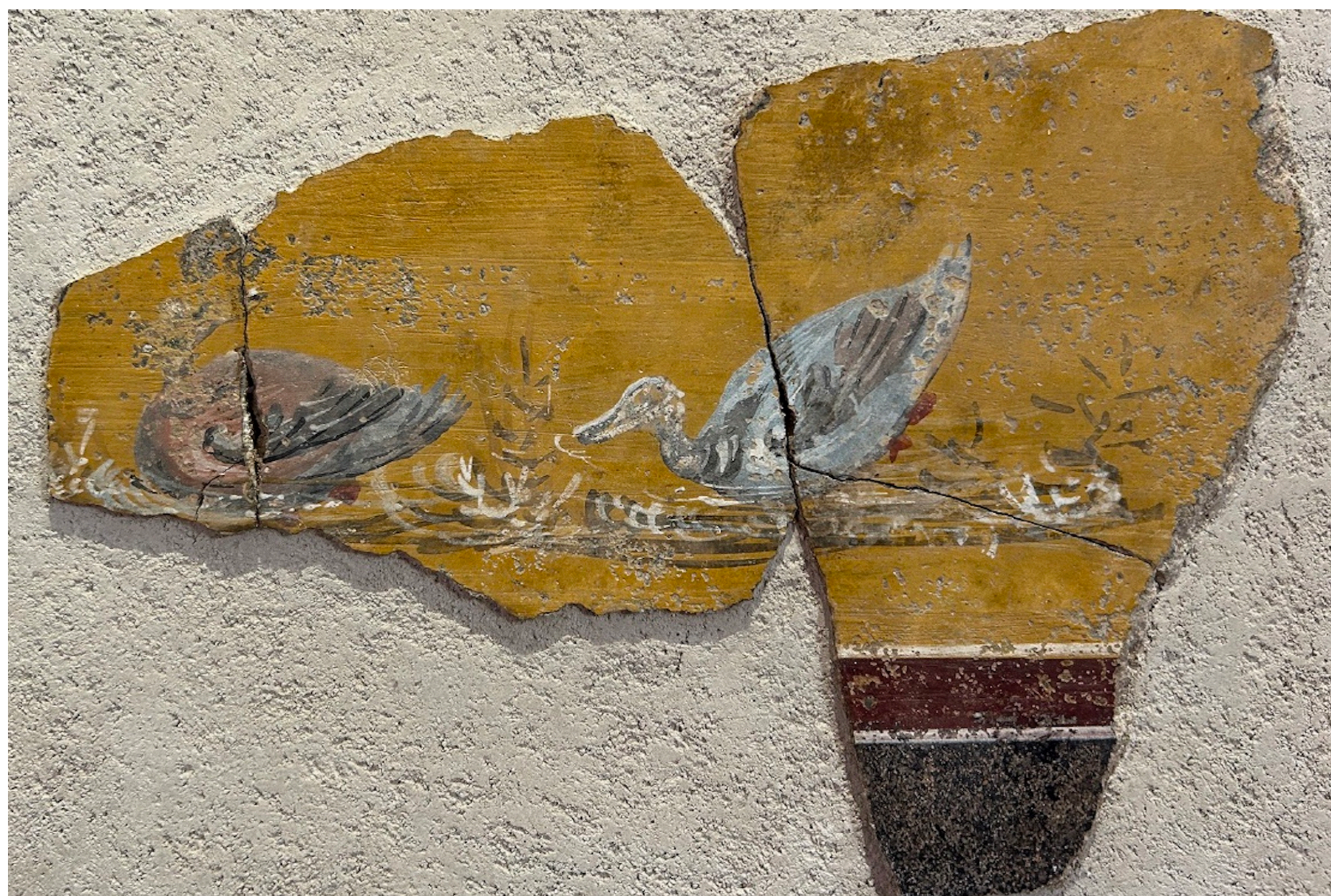
Fig. 1. Frammento nilotico dagli scavi della Casa di via Carmine 10, Venafro, Museo Archeologico di Venafro.

Il frammento pittorico in disamina si trova attualmente conservato presso il Museo Archeologico di Venafro e proviene dagli scavi della Casa di via Carmine 10, ambiente 1 (Fig. 1). Nell'attestazione, che insieme al resto del materiale pittorico si data al II secolo d.C., si osserva uno sfondo giallo separato da una zona a campitura nera tramite una banda rossa inquadrata da due sottili bande bianche. Si distingue una coppia di anatre che sta nuotando in uno specchio d'acqua, dove spiccano anche alcune piante acquatiche rese nei toni del grigio scuro e bianco. La palette cromatica prevede la rappresentazione di un'anatra, di cui si è perduta quasi completamente la testa ed il becco, nelle tonalità del marroncino e del grigio con la definizione delle piume tramite alcune sottili pennellate nere e bianche. Il secondo esemplare, conservato nella sua figura completa, è realizzato in toni che variano dal grigio-azzurro al grigio-marrone con l'enfasi del piumaggio tramite tratti sottili neri e l'impiego di lummeggiature bianche. In alcuni punti si osserva la caduta del pigmento; ancora individuabile è il cenno di color marrone-rossastro impiegato per indicare le zampe.