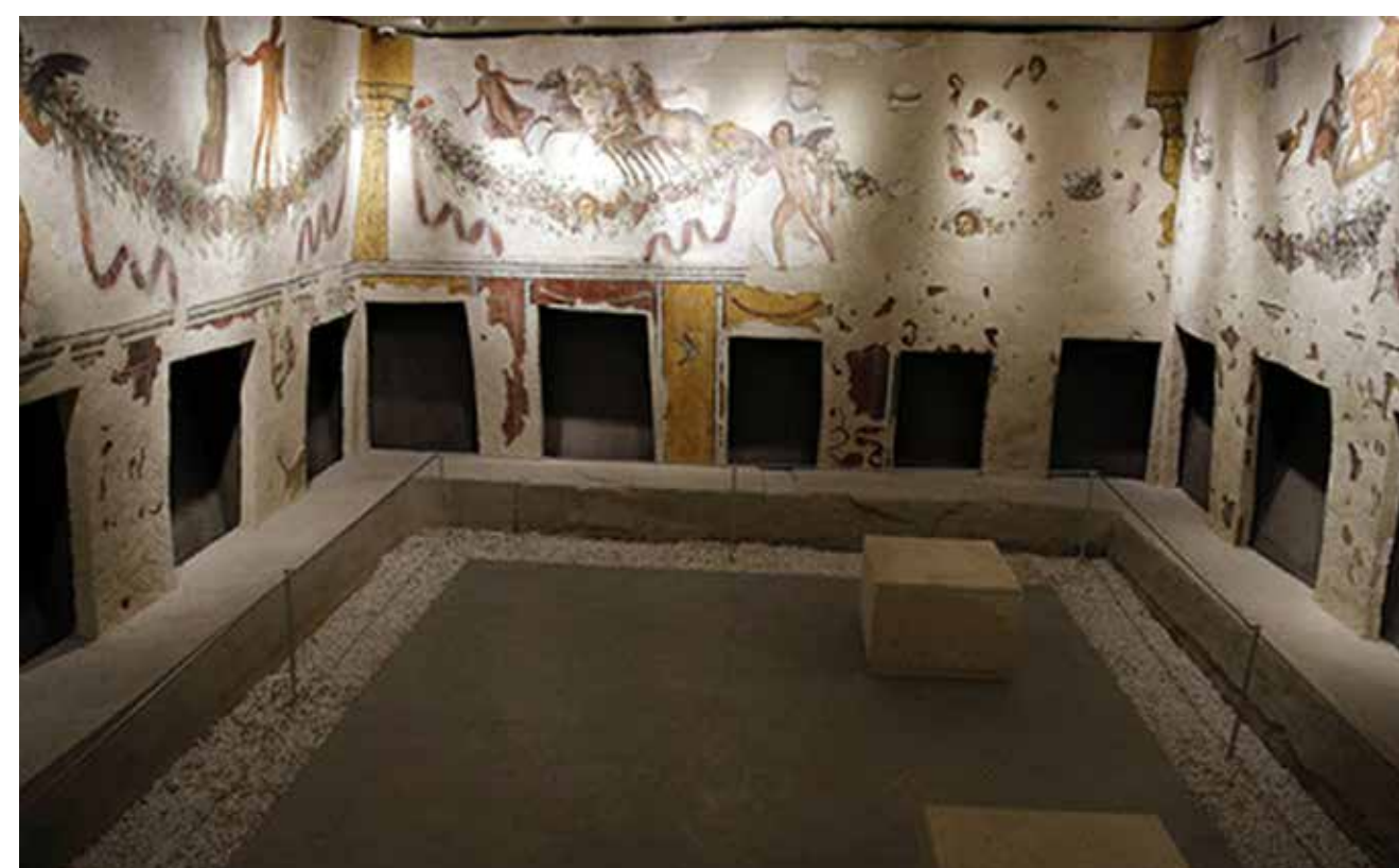
4. Tombe de Tyr.