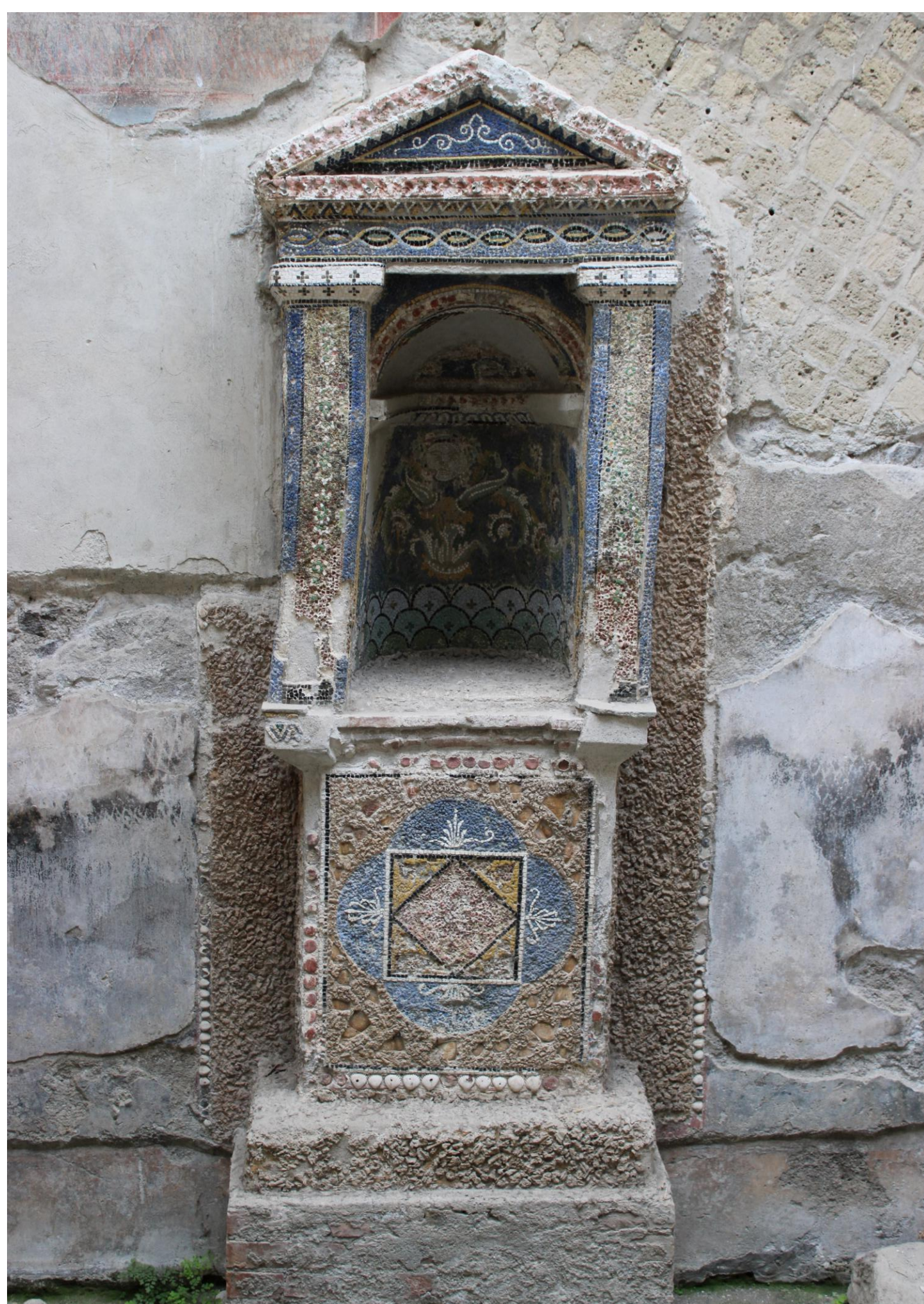
Fig. 1 L'edicola a mosaico della Casa dello Scheletro (III, 3)